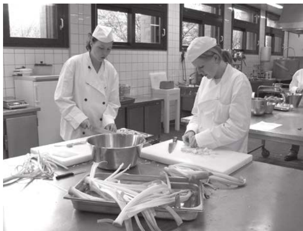
Ausbildung in der Großküche

Sie haben bis zu 36 Stunden Unterricht pro Woche. Er wird montags bis freitags vorwiegend in der Zeit von 8:00 - 14:45 Uhr in unserer Schule erteilt. Für Ihre praktische Ausbildung im Betrieb gelten die dort festgelegten Arbeitszeiten.