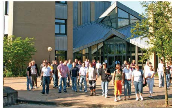
Zentrale Burgdorf Berliner Ring 28, 31303 Burgdorf Tel.: 05136/8992-0, Fax: 05136/8992-67 E-Mail: office@bbs-burgdorf.de Internet: www.bbs-burgdorf.de