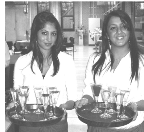
Ausbildung im Service

Nach dem Besuch der Berufsfachschule haben Sie die Schulpflicht erfüllt, wenn Sie anschließend kein Ausbildungsverhältnis eingehen.