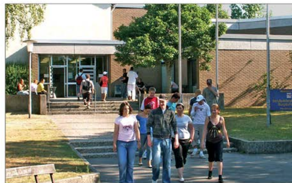
Standort Handelslehranstalt Vor dem Celler Tor 74, 31303 Burgdorf Tel.: 05136/8991-0, Fax: 05136/8991-17 E-Mail: verwaltung-hla@bbs-burgdorf.de