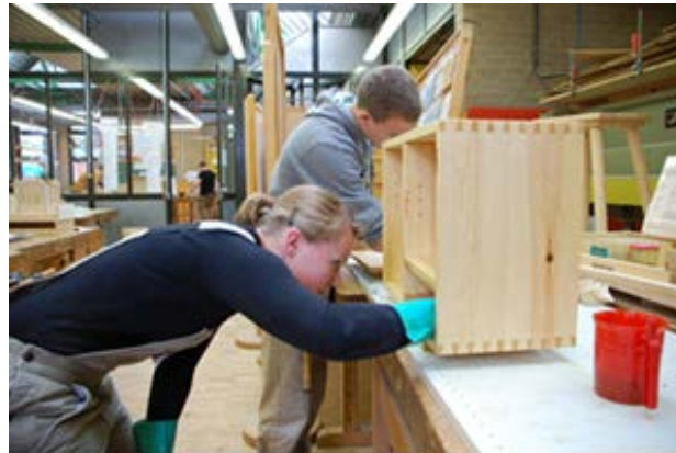
Unterricht in der Fachrichtung Holztechnik