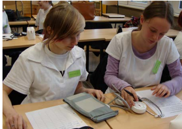
Grundkompetenzen pflegerischen Handelns

Mindestens 160 Stunden des berufsbezogenen Lernbereichs – Praxis – werden Sie als praktische Ausbildung in geeigneten Betrieben durchführen.