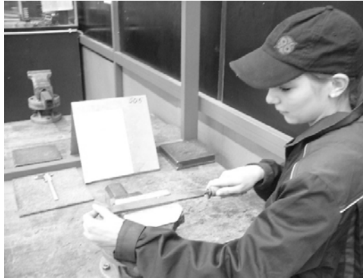
Werkstoffbearbeitung - manuell-

Für Ihre praktische Ausbildung im Betrieb gelten die dort festgelegten Arbeitszeiten.