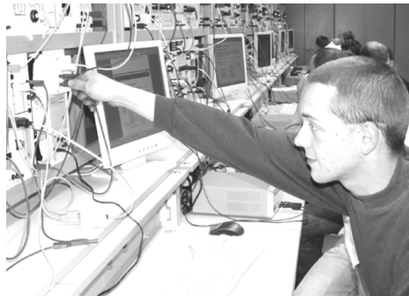
Analyse von elektr. Schaltungen im Elektronik Labor

Sie haben 36 Stunden Unterricht pro Woche. Er findet von Montag bis Freitag zwischen 8:00 und 14:45 Uhr statt.